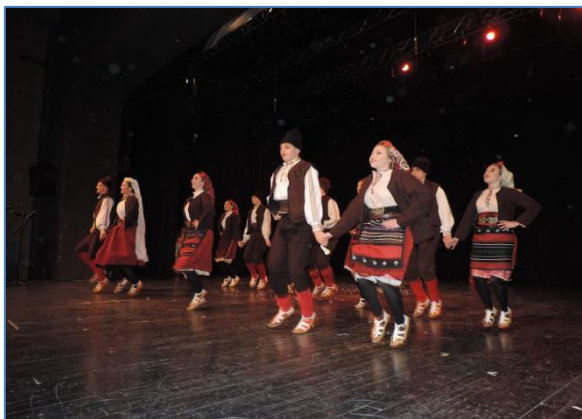
Слика 4. Наступ на Домијади

Драмска секција након аудиције и почетка рада у септембру школске 2018/2019 године имала је укупно 8 сталних чланова и 2 члана који су долазили с времена на време. Почетак рада заснован је на основним вежбама сценског покрета и дикције, ослобађања кроз краће форме