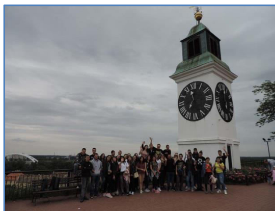
Слика 2. Наградни излет

3 искључења. Педесет два ученика завршило је школску годину са изреченим васпитно дисциплинским мерама, а 8 ученика је поступно санкционисано.