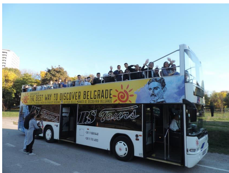
Слика 3. Разгледање града