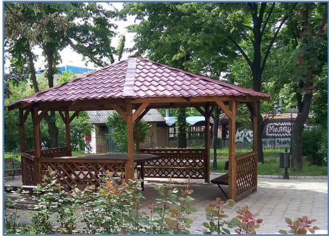
Слика 1. Учионица на отвореном