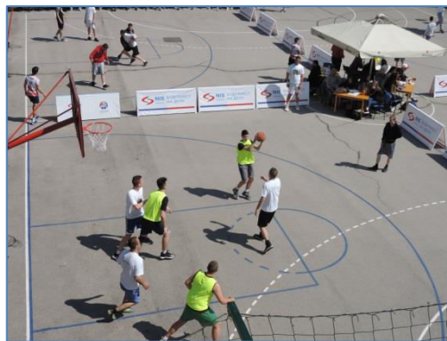
Слика 5. Хуманитарни турнир у баскету

Рад Домског парламента у децембру 2018. год. традиционално су обележили осмишљавање и реализација хуманитарне акције, која је овог пута била посвећена Дому за децу без родитељског старања „Споменак“ из Панчева. Значај здраве средине и здравих животних стилова били су предмет предавања и радионице које су одржали представници НВО „Центар за креирање политика“. Током априла месеца на иницијативу Домског парламента, на кошаркашким теренима Дома, одржан је и ове године хуманитарни турнир у баскету „Играјмо за Ђорђа“, са циљем прикупљања новчаних средстава за лечење дечака из околине Крупња, оболелог од тешког облика епилепсије и делимичне парализе. Овај турнир подржале су многе познате личности, организације, домови ученика. У турниру је учествовало 70 екипа.